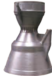
全尺寸喷管 IN718 高温镍基合金 230mm*401mm*554mm