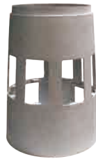
舱段 铝合金 Φ340mm*470mm