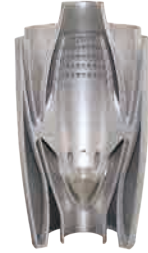
燃烧室 GH4169 Φ308mm*603mm