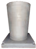
导弹筒分段 钛合金 Φ220mm*310mm