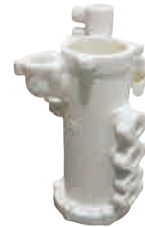
壳体 PSB 粉末 160mm*200mm*300mm